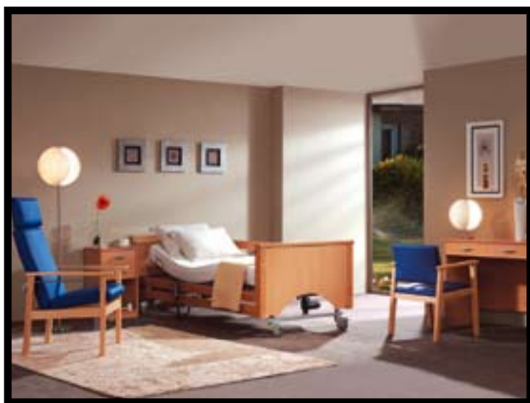
Colección Aura de ECUS GERIATRIC

distribuidora equipó unas 2.000 plazas para varios clientes, incluido el grupo PERSONALIA, que también forma parte del grupo ONCE.