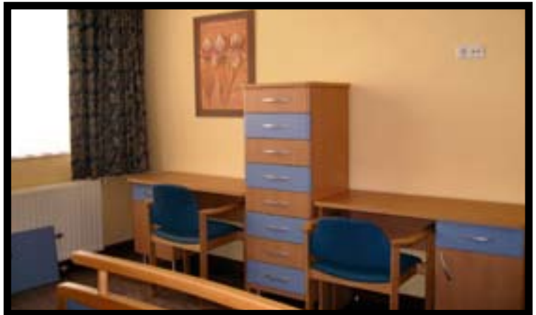
Residencia en Guadalajara, equipada por GERO-MOBEL

Pero además de la estética, el diseño del mueble geriátrico debe tener en cuenta las actividades cotidianas de los mayores y sus limitaciones ergo-