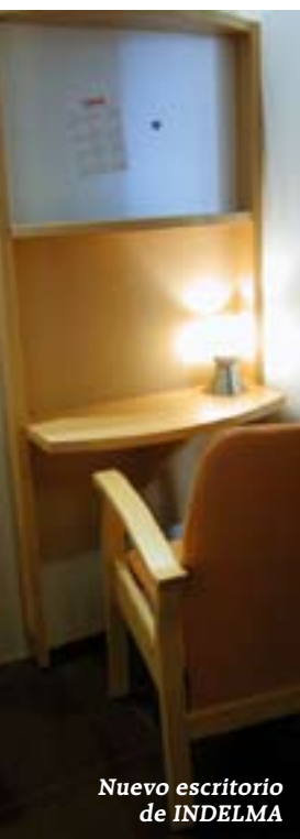
Nuevo escritorio de INDELMA