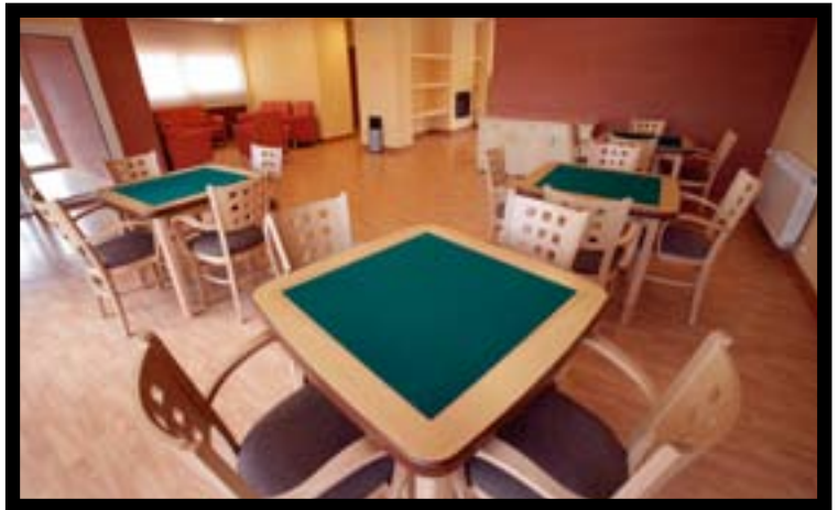
Residencia Decanos Ávila, equipada por MEDICAL DISS

El auge del sector también empujó a la catalana INDELMA a volver a apostar por el mobiliario geriátrico, un mercado en el que estuvo presente en los 70 (equipó varias residencias del IMSERSO), pero que había aparcado en los 80. En 2000, INDELMA presentó sus colecciones para mayores, pero manteniendo su actividad principal, la fabricación de mobiliario de hogar. Poco a poco ha ido rebajando el peso de la segunda y centrándose en su nuevo público objetivo. Actualmente, INDELMA está preparada para realizar equipamientos llave en mano. Uno de sus puntos fuertes es la capacidad de producción, por contar con fábrica propia, ya que en este sector son habituales los pedidos grandes en poco tiempo.