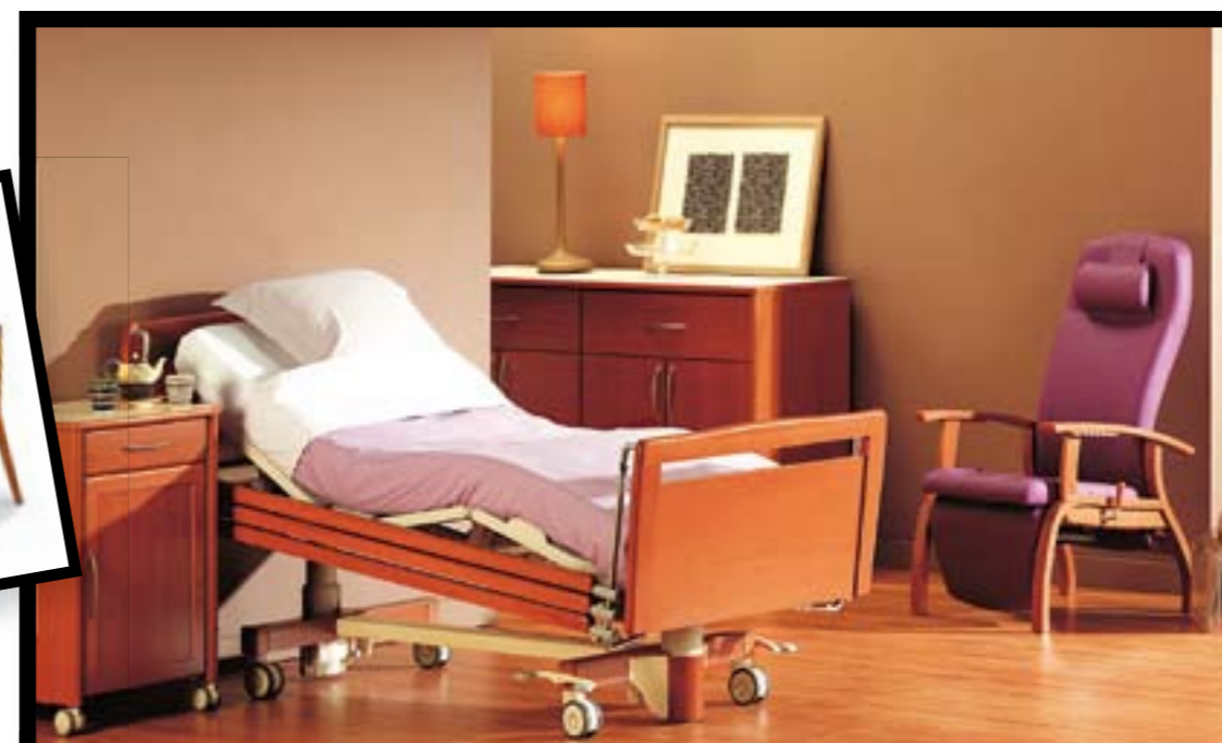
Ambiente Alano de ECUS GERIATRIC