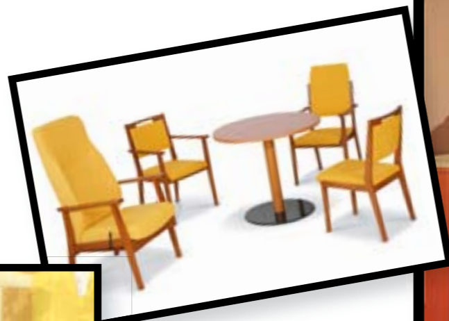
Colección Swing de GERIÁTRICA MARTÍN IBÁÑEZ

Concebidas las residencias como el hogar permanente de los más mayores, en los últimos años se han empezado a imponer nuevas líneas de mobiliario, que integran las exigencias ergonómicas con un cuidadoso diseño. Se trata de crear un clima lo más cercano posible al domicilio del anciano, huyendo de las tradicionales líneas hospitalarias, pero sin descuidar las prestaciones necesarias.