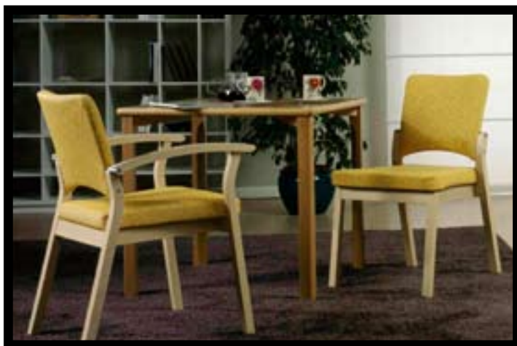
Butaca Piaval, comercializada por GERIÁTRICA MARTÍN IBÁÑEZ

adaptarse a estos nuevos “problemas” que aparecen con la edad.