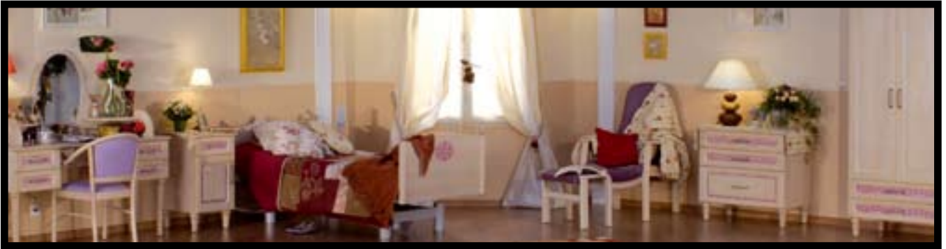
Colección Gwanara, de HILL-ROM

res, que representa el 20% de sus ingresos. En la actualidad, su producción se sitúa en torno a los 5.000 sillones anuales y unas 1.200 plazas residenciales equipadas. TAGAR también está desarrollando su segunda colección, que presentará a finales de este año y, como novedad más inmediata, está preparando una nueva colección de respaldos en espuma inyectada. En el sector geriátrico su principal objetivo es crecer en el exterior, fundamentalmente en Europa, con la intención de que las ventas fuera de