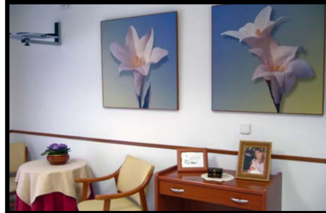
Residencia Care, en Meco (Madrid)